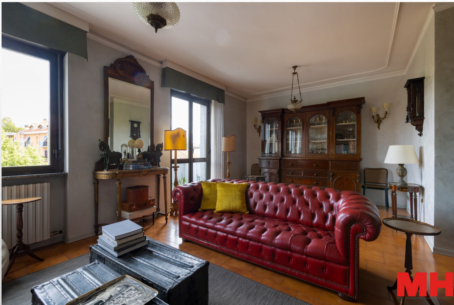
Vimodrone -Via dei Mille, 1 – Tre locali doppi servizi con Box e posto auto