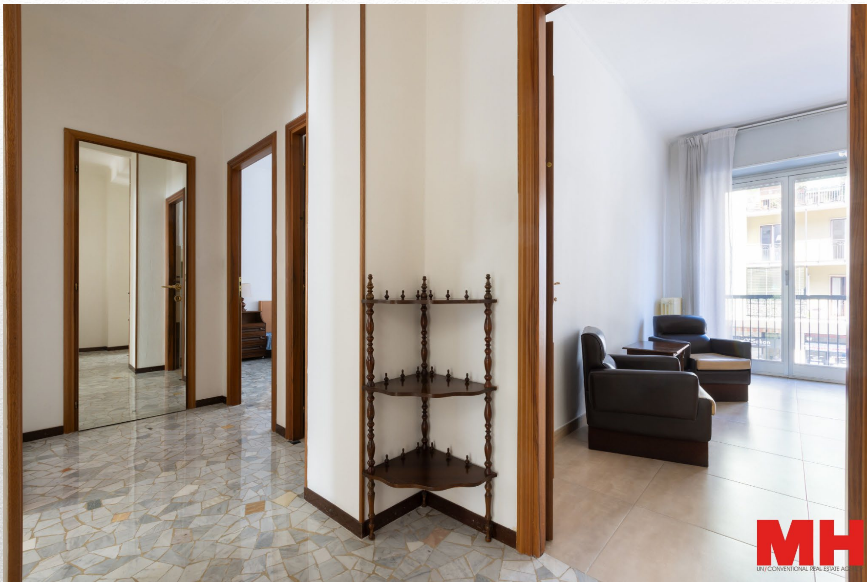
Via Cenisio, 23 – Tre locali con cucina abitabile