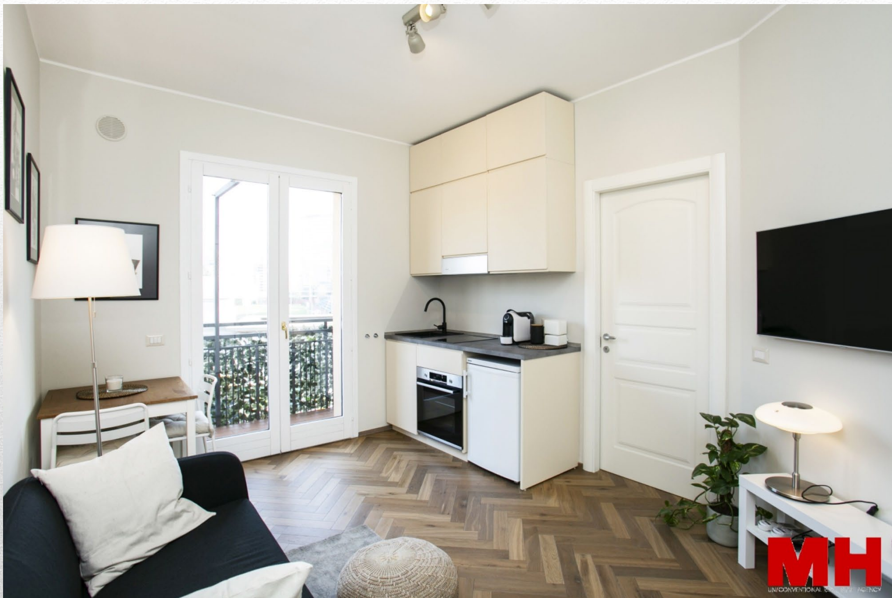
Milano - Via De Lemene, 18 – DUE locali